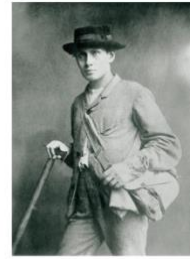
Edward Whymper: Erstbesteiger des Matterhorn am 14. Juli 1865